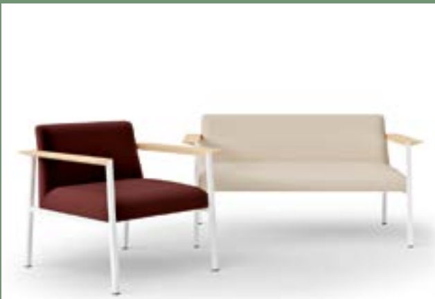
Lounge and conference chairs