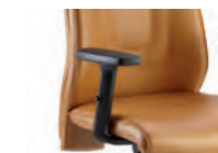
Braccioli in nylon regolabile. Armrests in adjustable nylon.