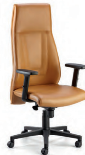
SPH31 Poltrona presidenziale con braccioli e oscillante mov. 19. Presidential armchair with mov. 19 tilting.