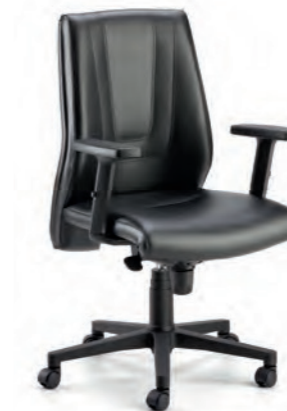
SPH33 Poltrona direzionale con braccioli e oscillante mov. 19. Directional armchair with mov. 19 tilting.