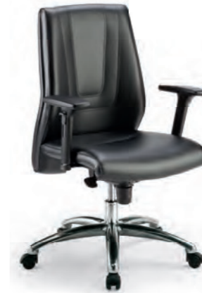
SPH13 Poltrona direzionale con braccioli e oscillante mov. 19. Directional armchair with mov. 19 tilting.