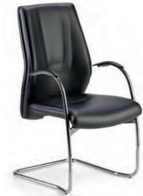
SPH18 Poltrona attesa fissa con braccioli. Fixed armchair.