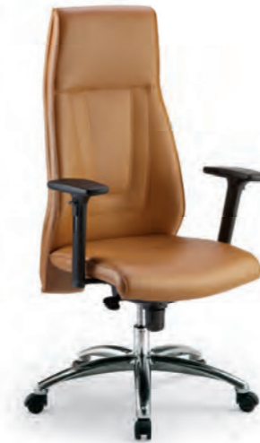
SPH11 Poltrona presidenziale con braccioli e oscillante mov. 19. Presidential armchair with mov. 19 tilting.